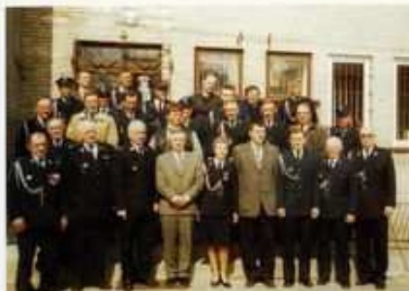
Powiatowe i gminne władze samorządowe oraz przedstawiciele Oddziału Powiatowego ZOŚP RP w Łęczycy byli częstymi gośćmi strażaków w Górze Św. Małgorzaty

Na terenie gminy funkcjonuje 8 jednostek OSP. W tym 2 jednostki typu S. Są to OSP Góra Św. Małgorzaty i OSP Marynki. Pozostałe 6 jednostek są typu M. Należą do nich jednostki OSP w Ambrożewie, Morakowie, Starym Gaju, Zagaju – Rogulicach, Sługach, Tumie. Zarząd Gminny był organizatorem gminnych zawodów sportowo pożarniczych oraz ćwiczeń i manewrów sprawdzających sprawność i mobilność poszczególnych jednostek. We współpracy z Zarządem Gminnym w Witoni organizowano ćwiczenia dla jednostek z obydwu gmin. Do współpracy w następnych latach przyłączyły się pozostałe gminy. W ćwiczeniach na obiekcie Kościoła w Górze Św. Małgorzaty uczestniczyło 13 zastępów ratowniczych, w tym wszystkie jednostki z terenu powiatu łęczyckiego włączone do KSRG oraz 2 zastępy z JRG z Łęczycy