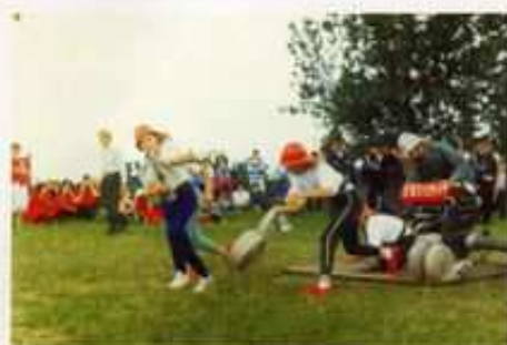
Gmina Witonia szczyti się dużą liczbą MDP.