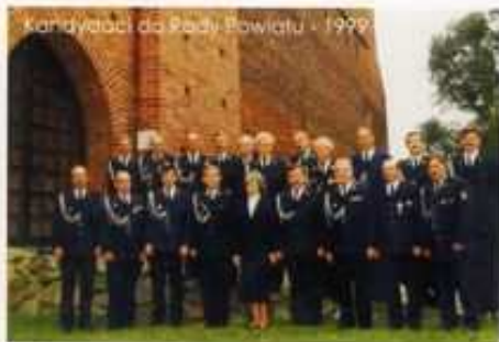
Kandydaci do Rady Powiatu - 1999

N a uwagę zasługuje fakt utworzenia Komitetu Wyborczego Wyborców „STRAŻAK” w kampanii wyborczej do samorządów gminnych, miejsko - gminnego oraz powiatowego w Łęczycy.