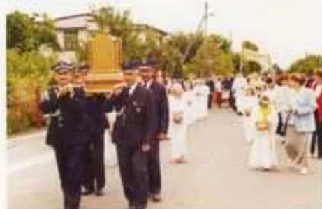
Boże Ciało 2004.