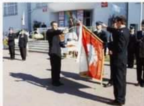
Rok 2003. Podczas uroczystości 100 lecia OSP odbyło się ślubowanie strażaków

Naczelnika OSP, Zarząd powołał Jednostkę Operacyjno-Techniczną kat. II w składzie 33 strażaków- ratowników, którzy posiadają odpowiednie przeszkolenie. Do dyspozycji JOT-u są cztery samochody pożarnicze.