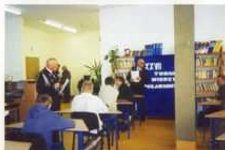
Gminne eliminacje XXVII OTWP pł „Młodzież Zapobiega pożarom” w Witoni.