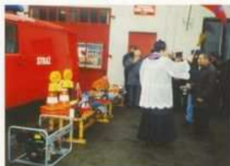
Wyświęcenie samochodu Lublin przeznaczonego do ratownictwa drogowego.

Przez wybraną Komisję przeprowadzono we wszystkich jednostkach kontrolę pod względem zabezpieczenia sprzętu. Stwierdzono, że we wszystkich jednostkach są prowadzone prace remontowe.