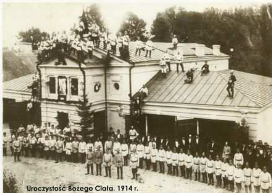
Uroczystość Bożego Ciała. 1914 r.

- 1965 rok - uroczystość obchodów jubileuszu 90 - lecia OSP. Wręczony został nowy sztandar ufundowany przez społeczeństwo Łęczyczy. Zarząd Główny OSP uhonorował jednostkę