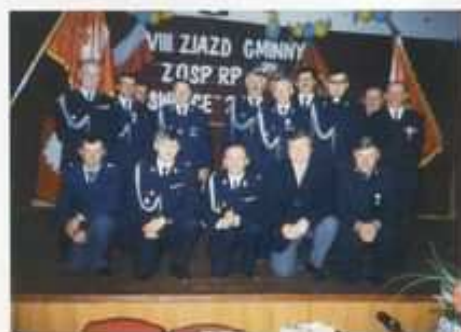
Zarząd Oddziału Gminnego ZOSP RP w Świnicach Warckich.