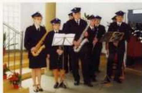
Młodzieżowy zespół muzyczny z Witoni wystąpił w części artystycznej na Plenarnym Posiedzeniu Zarządu Oddziału Powiatowego ZOŚP RP.