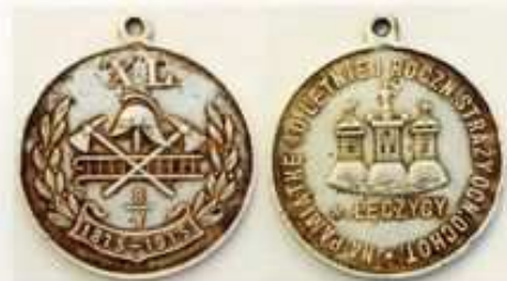
W zbiorach Izby Tradycji znajduje się min. Medal z 1915 roku

- 21.05.2006 - wręczony został nowy sztandar dla OSP