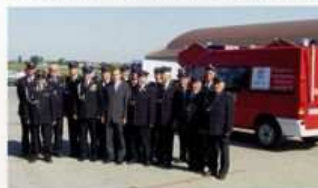
Samochód do ratownictwa drogowego zakupiony w 2005 r przy dużym wsparciu Zarządu Głównego Związku OSP RP oraz Wojewódzkiego Funduszu Ochrony Środowiska i Gospodarki Wodnej

Jednostka OSP w Górze Św. Małgorzaty została powołana pod nazwą Stowarzyszenie Ochotniczej Straży Ogniowej dnia 2 września 1928 roku. Potwierdza to data umieszczona na sztandarze jednostki ufundowanym przez społeczeństwo wsi na dziesięciolecie jej istnienia. W roku 1995 włączona została do KSRG. Ze względu na swoje centralne położenie oparto na niej gminny system ochrony przeciwpożarowej. Obecnie jednostka wyposażona jest w 2 samochody ciężkie typu Jelcz i Tatra, samochód Żuk i samochód Ford przeznaczony do ratownictwa drogowego. Przy OSP funkcjonuje sala widowiskowa, może pomieścić około 300-350 osób. Gospodarze zapewniają dla tej ilości pełny zestaw stołów i ławek oraz komplet nakryć stołowych. Zaplecze kuchenne wyposażone jest w chłodzię.