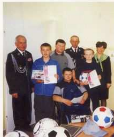
Gimnazjum w Daszynie. Dyrektor gimnazjum, Jury i laureaci eliminacji gminnej Ogólnopolskiego Turnieju Wiedzy Pożarniczej - 2002 r.