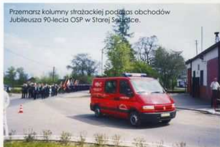
Przemarsz kolumny strażackiej podczas obchodów Jubileusza 90-lecia OSP w Starej Szałtce.