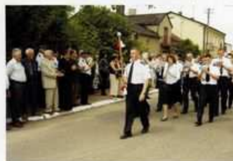
Reaktywowana przy OSP w Górze Św. Małgorzaty orkiestra liczy blisko 30 członków.