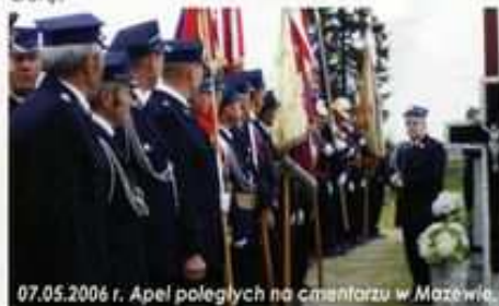
07.05.2006 r. Apel poległych na cmentarzu w Mazewie.