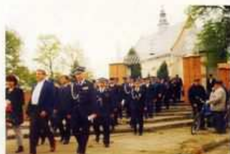
Jubileusz 90-lecia OSP w Grodzisku, 2003 r.