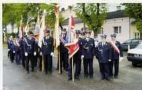
Częstochowa, 07.05.2006 r. Poczty Sztandarowe OSP z Gminy Daszyna przed wymarszem na Jasną Górę.