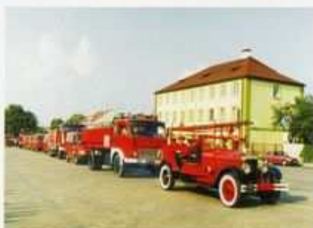
Kolumna samochodów strażackich, na czele historycznym samochodem z OSP Niepokalanów. Łęczycy, Pl. Przedrynek - 08.09.2002r.