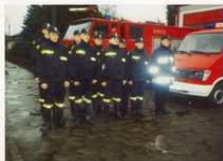
Sekcja bojowa OSP Witonia.