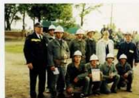
Strażacy z OSP w Ambrożewie na gminnych zawodach sportowo – pożarniczych zajęli II miejsce. Rok 2006.