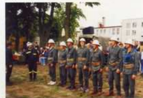
Strażacy z OSP Stary Gaj na Gminnych Zawodach Sportowo-Pożarniczych – 2002 rok.