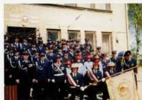
Parafialne uroczystości Dnia Strażaka, Góra Św. Małgorzaty 2005.