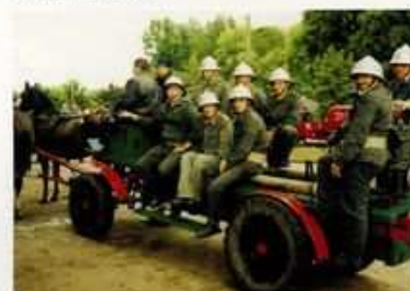
Na gminne zawody sportowo-pożarnicze OSP w Morakowie przybyła starym pojazdem konnym.