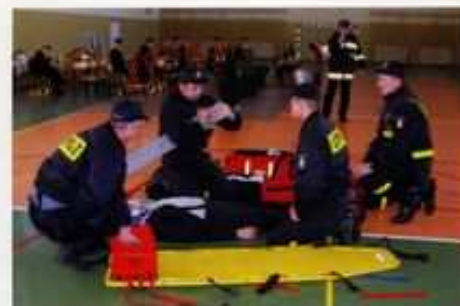
Pokazy ratownictwa medycznego.

Członkowie OSP Piątek biorą też udział w gminnych i powiatowych zawodach sportowo-pożarniczych oraz manewrach.